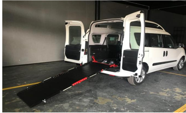
Engelli Rampası açık konum görüntüsü