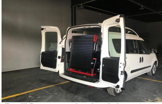
Engelli Rampası araç bagajı yerleşim görüntüsü