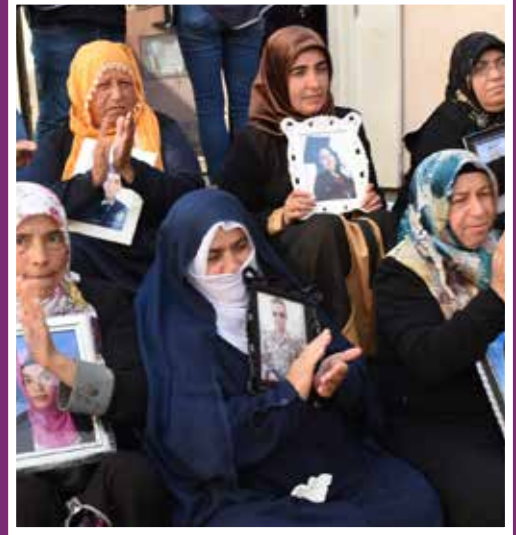
Çorum heyeti yanlarında getirdikleri leblebi ve yazmaları annelere hediye ettiler.

Kendilerine yapılan ziyaretlerden dolayı memnuniyetlerini dile getiren ailelerde Çorum heyetine teşekkür ederek Çorum'a selam gönderdiler.